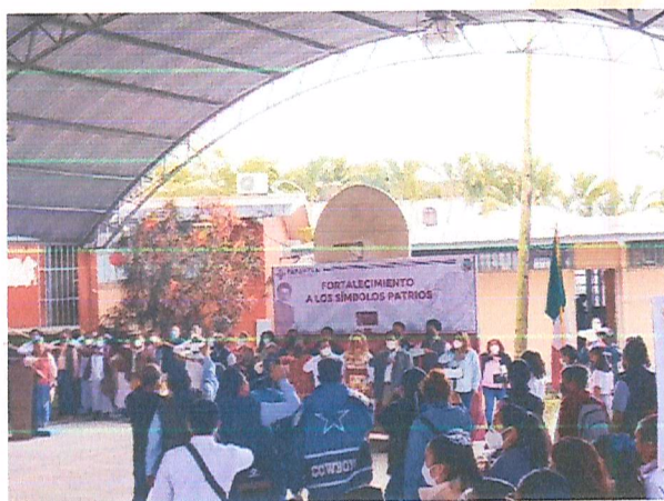
Imagen 6. Acto cívico.