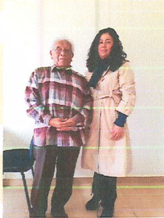
Imagen 4. Reunión.