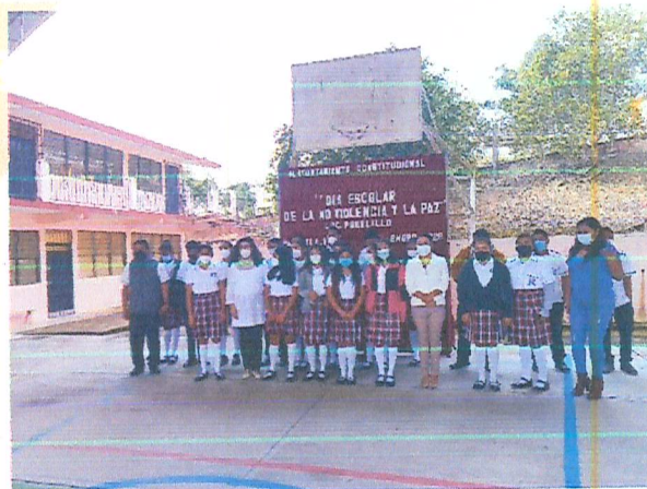
Imagen 9. Recorrido en Tele Bachillerato.