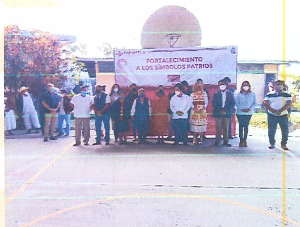
Imagen 7. Acto cívico.