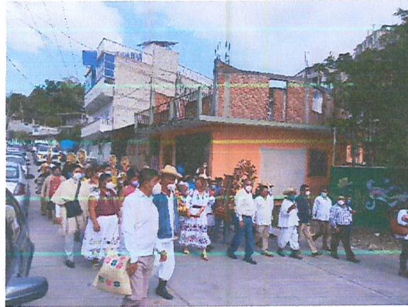
Imagen 3. Caminata..