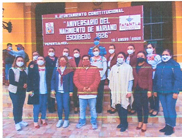
Imagen 1. Aniversario del nacimiento de Mariano Escobedo