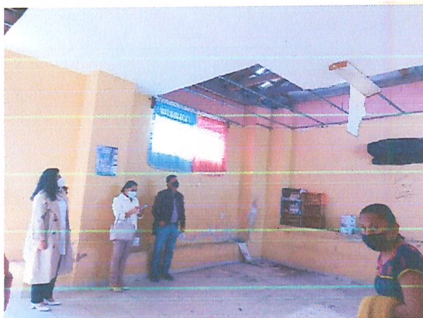
Imagen 8. Recorrido en Telesecundaria.