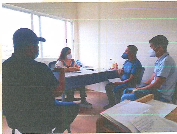
Imagen 5. Reunión de trabajo.