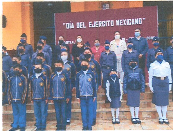
Imagen 9. Día del ejército.