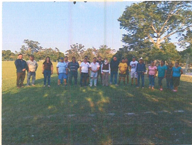
Imagen 1. Platica.