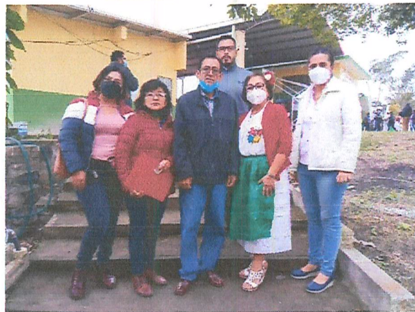
Imagen 18. Recorrido.