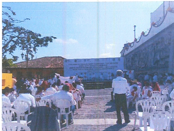
Imagen 12. Día de las Lenguas Indígenas.