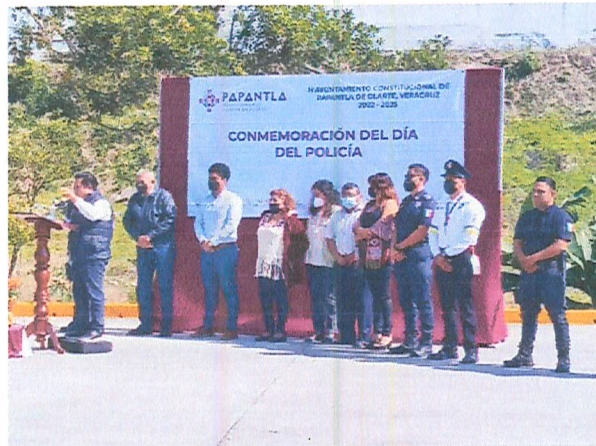
Imagen 6. Conmemoración.