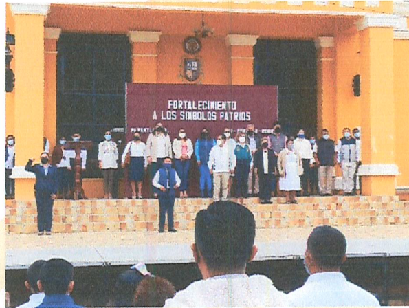
Imagen 11. Acto Cívico.