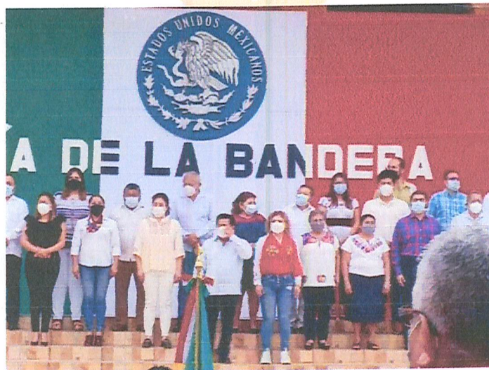
Imagen 14. Día de la Bandera.