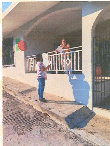
Imagen 8. Entrega de invitaciones.