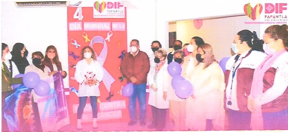
Imagen 3. Evento.