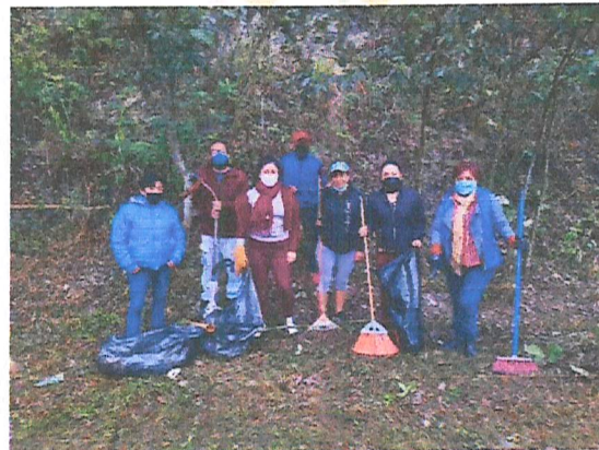
Imagen 10. Jornada de limpieza.