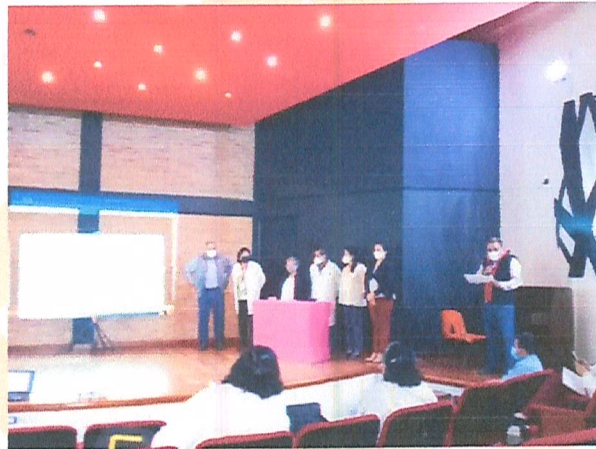
Imagen 5. Capacitación.