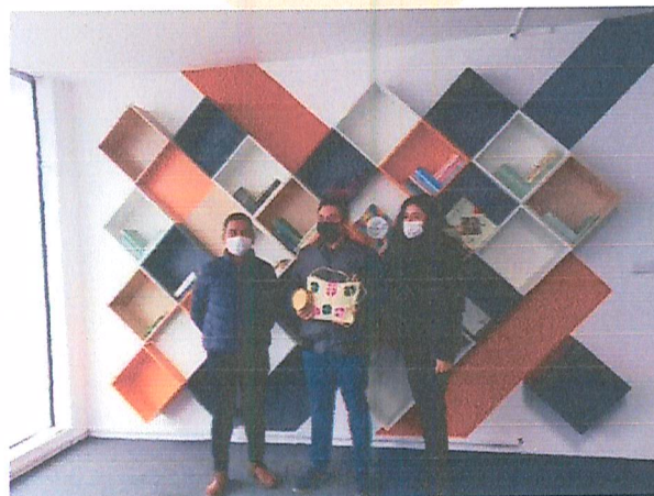
Imagen 4. Reunión.