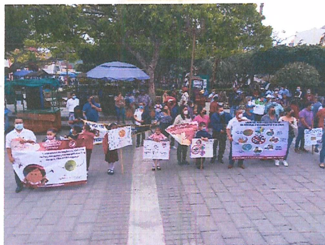
Imagen 2. Banderazo.