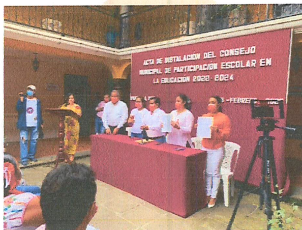
Imagen 16. Instalación del Consejo Municipal.