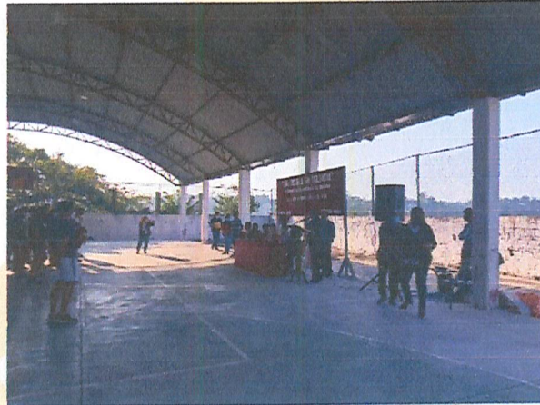
Imagen 15. Una Escuela sin Violencia.