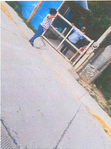
Imagen 7. Entrega de invitaciones.