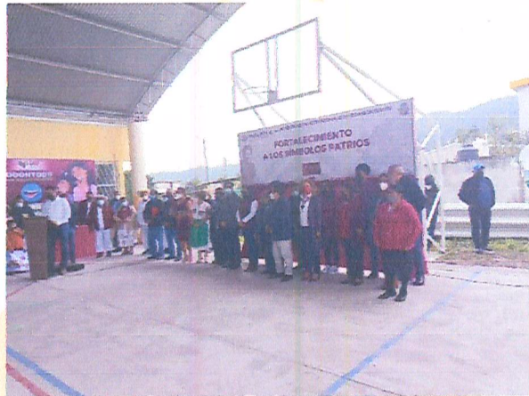
Imagen 17. Acto cívico.