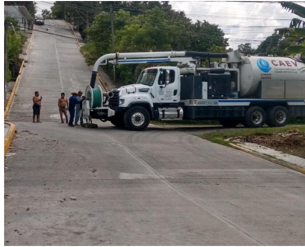
COL. UNIDAD Y TRABAJO